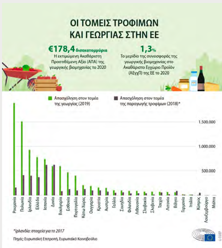
Οι τομείς των τροφίμων και της γεωργίας στην ΕΕ

Οι αγρότες και ο γεωργικός τομέας δέχθηκαν ισχυρό πλήγμα από τον κορονοϊό και η ΕΕ θέσπισε ειδικά μέτρα για τη στήριξη της βιομηχανίας και των εισοδημάτων. Η μελλοντική μεταρρύθμιση της ΚΓΠ αναμένεται να τεθεί σε εφαρμογή από το 2023 λόγω καθυστερήσεων στη διαπραγμάτευση του προϋπολογισμού. Ήταν απαραίτητη η σύναψη διακρατικής συμφωνίας για την προστασία των εισοδημάτων των αγροτών και της διασφάλισης επισιτικής ασφάλειας.