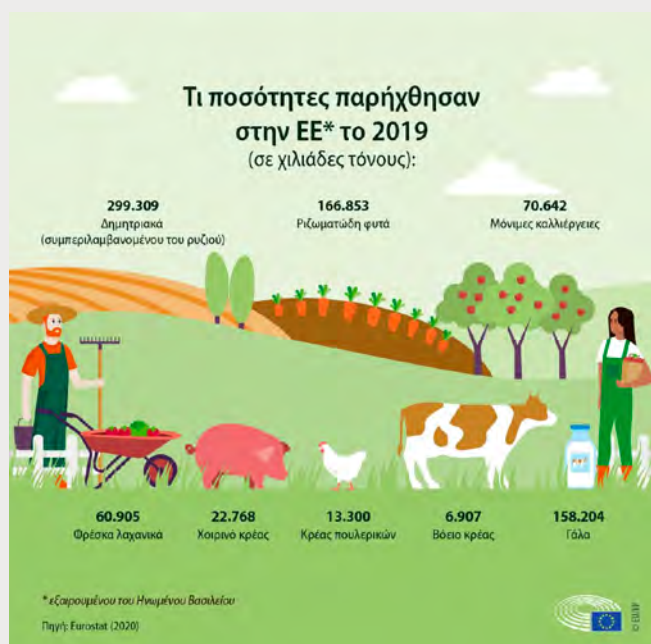
Παραγωγή τροφίμων στην ΕΕ