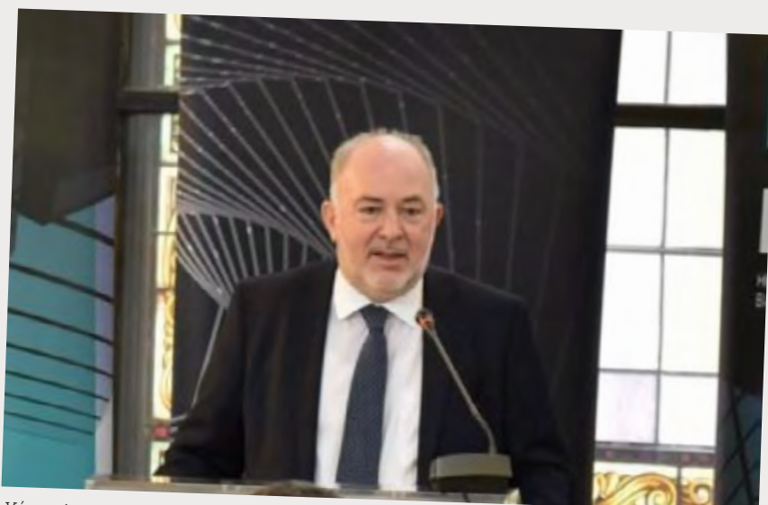
Χάρης Λαμπρόπουλος, Πρόεδρος ΕΑΤΕ

Ο Πρόεδρος της ΕΑΤΕ, Καθηγητής κ. Χάρης Λαμπρόπουλος καλωσόρισε τους συμμετέχοντες στον χώρο του πρόσφατα εγκαινιασθέντος «Κέντρου Επιχειρηματικότητας Κωνσταντίνος Μίχαλος» του ΕΒΕΑ, που όπως έχει ανακοινώσει ο Πρόεδρος του ΕΒΕΑ κ. Πάννης Μπρατάκος, φιλοδοξεί να εξελιχθεί σε ένα ανοικτό σπίτι σύνδεσης των επιχειρήσεων και της καινοτομίας δικτυώνοντας όλους τους απαραίτητους stakeholders. Τόνισε τη στενή συνεργασία με τον Υφυπουργό Ανάπτυξης και Επενδύσεων κ. Πάννη Τσακίρη για την αξιοποίηση των ευκαιριών που δημιουργούνται για τις ελληνικές επιχειρήσεις. Έδωσε έμφαση επίσης στη στρατηγική συνεργασία με τη Γαλλική Αναπτυξιακή Τράπεζα (BPI France), καθώς και στο ότι η ΕΑΤΕ συμμετέχει ενεργά στον ευρωπαϊκό διάλογο, αλλά και στην προσπάθεια στήριξης των