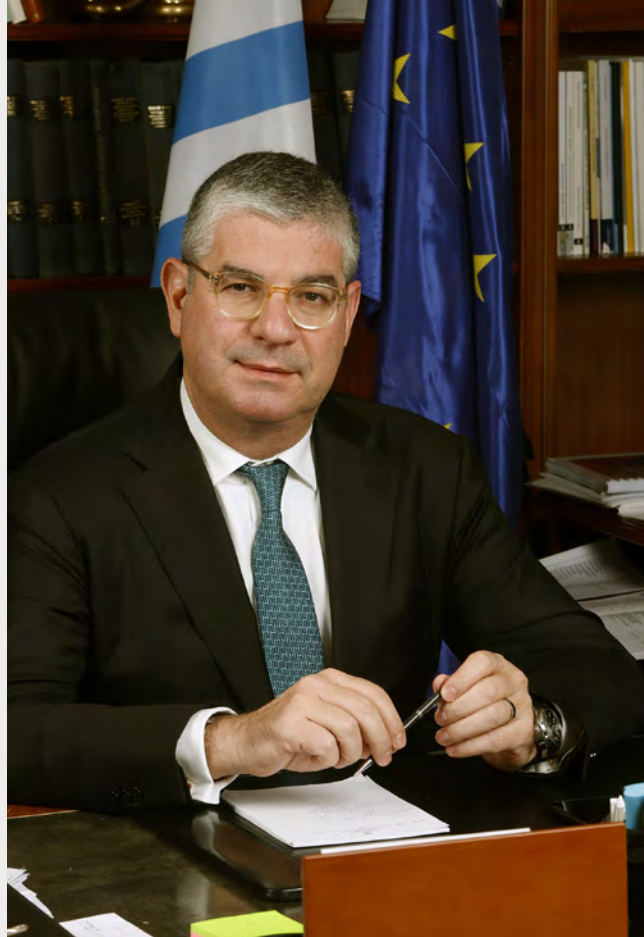
Πάννης Τσακίρης, Υφυπουργός Ανάπτυξης και Επενδύσεων

Τόνισε ότι, η «ευρωπαϊκή σφραγίδα» πέραν της χρηματοδότησης αποτελεί μια εγγύηση αξιοπιστίας των projects, δημιουργεί ιδιαίτερη δυναμική γύρω από τις συγκεκριμένες επιχειρηματικές ιδέες, καθώς η ευρωπαϊκή αξιολόγηση δεν τους δίνει μόνον ώθηση, αλλά και τις βάζει στο ραντάρ των επενδυτών.