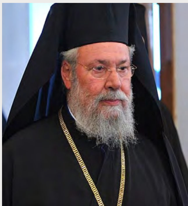
Αρχιεπίσκοπος Κύπρου Χρυσόστομος Β΄