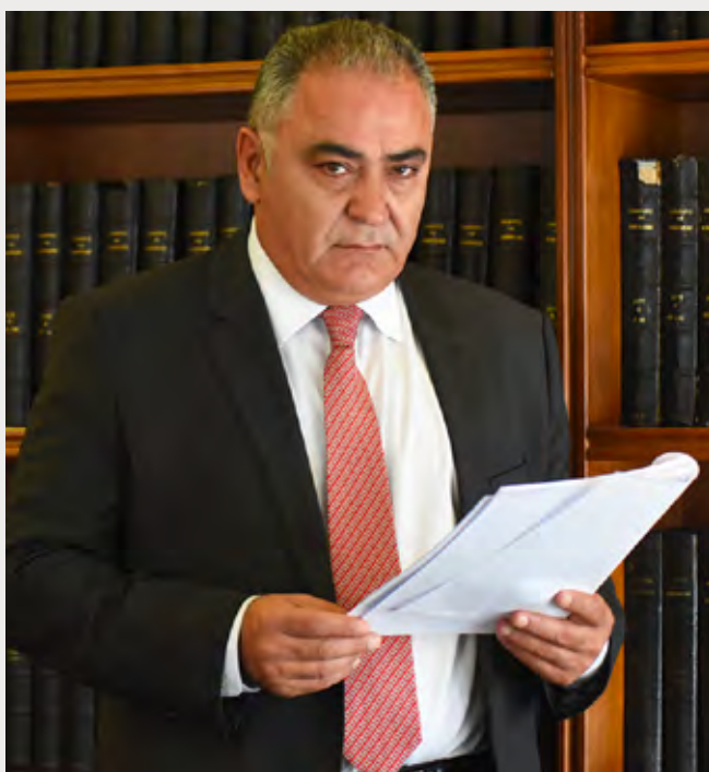
Πάνης Χατζηθεοδοσίου, Πρόεδρος της ΚΕΕΕ

Επιπλέον, αποφασίστηκε να ξεκινήσει μια στοχευμένη συνεργασία, ώστε αφενός οι ελληνικές επιχειρήσεις να διεισδύσουν προς τη Μέση Ανατολή, μέσω της κυπριακής αγοράς, αφετέρου δε, οι κυπριακές επιχειρήσεις να επεκταθούν προς τα Βαλκάνια, μέσω συνεργασίας με τις ελληνικές.