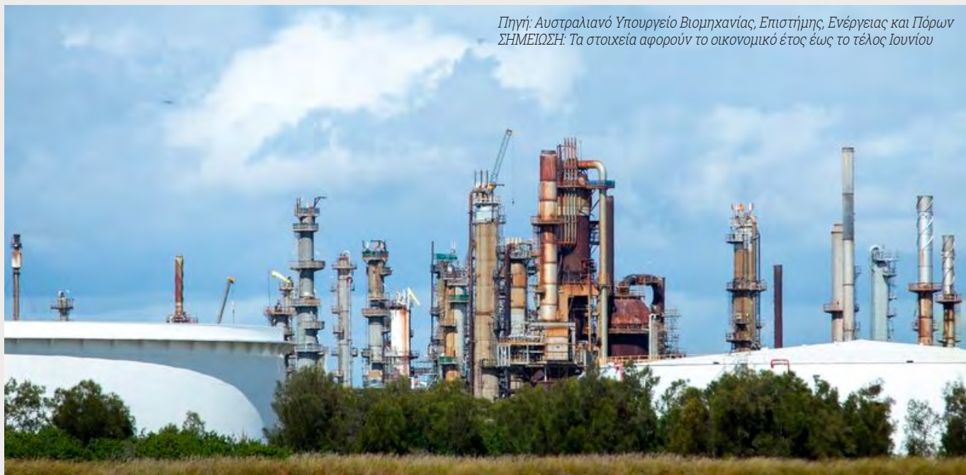
Δεξαμενές στο Μπρίσμπεϊν της Αυστραλίας.

ΣΗΜΕΙΩΣΗ: Τα στοιχεία αφορούν το οικονομικό έτος έως το τέλος Ιουνίου