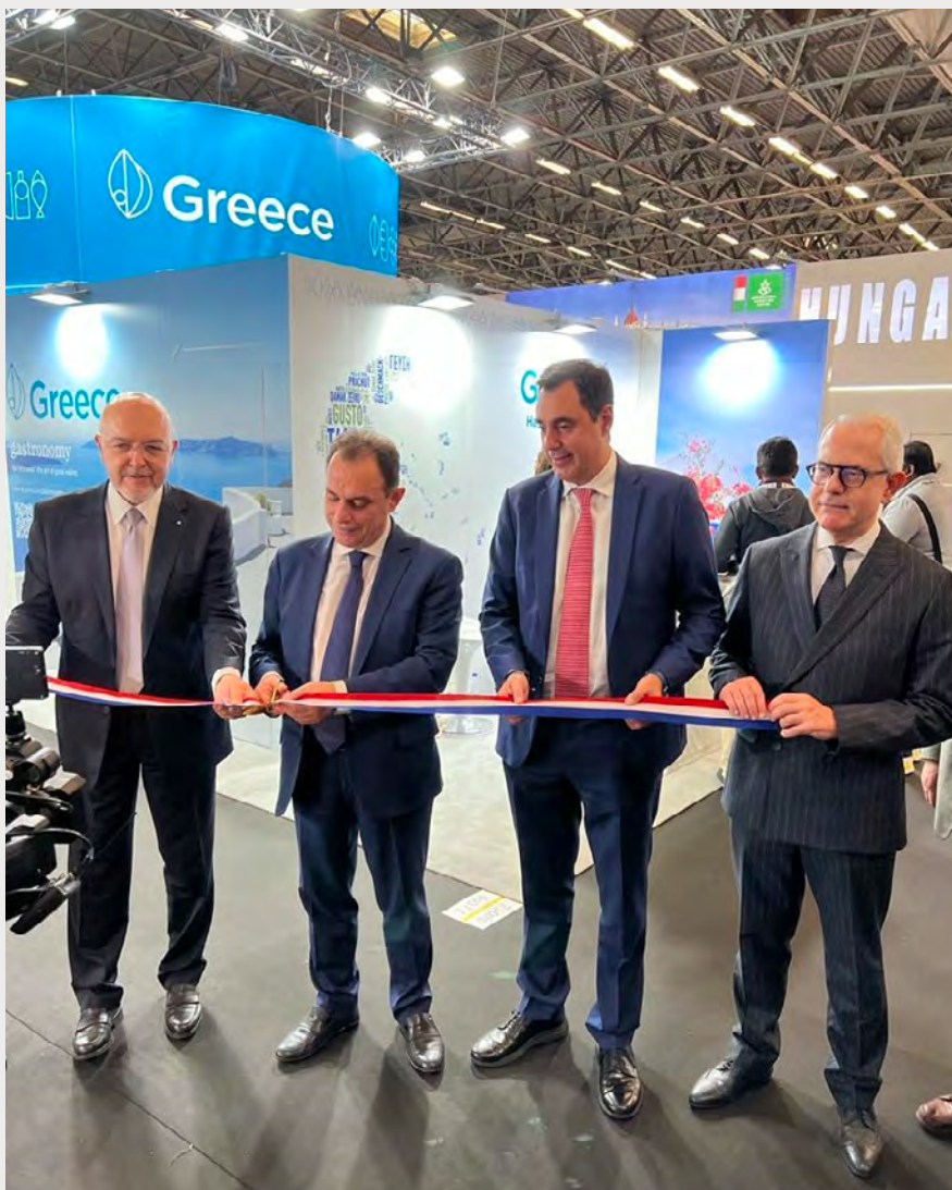
Ο Υφυπουργός Εξωτερικών, αρμόδιος για την Οικονομική Διπλωματία και την Εξωστρέφεια, Κώστας Φραγκογιάννης, ο Υπουργός Αγροτικής Ανάπτυξης και Τροφίμων, Γεώργιος Γεωργαντάς, ο Γενικός Γραμματέας Διεθνών Οικονομικών Σχέσεων του Υπουργείου Εξωτερικών και Πρόεδρος της Enterprise Greece, Ιωάννης Σμυρλής και ο Πρόεδρος της Ελλάδος στη Γαλλία, Δημήτριος Ζεβελάκης.

Ο Υφυπουργός Εξωτερικών, κος Κώστας Φραγκογιάννης, δήλωσε ότι: «Είμαι ιδιαίτερα ικανοποιημένος από τη δυναμική ελληνική παρουσία στο Παρίσι και τη μεγαλύτερη έκθεση τροφίμων και ποτών της χρονιάς. Με περισσότερες από 300 ελληνικές επιχειρήσεις, η Ελλάδα