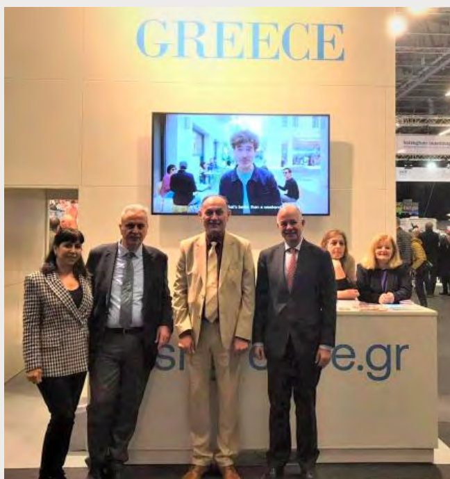
Στιγμιότυπο από την έκθεση Ferie For Alle 2023. Από αριστερά, η σύζυγος του Έλληνα πρέσβη, Π. Κατσιόγκρα, ο πρέσβης της Ελλάδας στην Δανία, Φρ. Κωστελλένος, ο προϊστάμενος της Υπηρεσίας ΕΟΤ Σκανδιναβίας, Π. Μούρμας, ο Πρέσβης της Κύπρου, Ι. Κιρακοσιάν, το στέλεχος του ΕΟΤ, Χ. Προκάκη, και η αναπληρώτρια προϊσταμένη της Υπηρεσίας ΕΟΤ Σκανδιναβίας, Μ. Ζευγουλά.