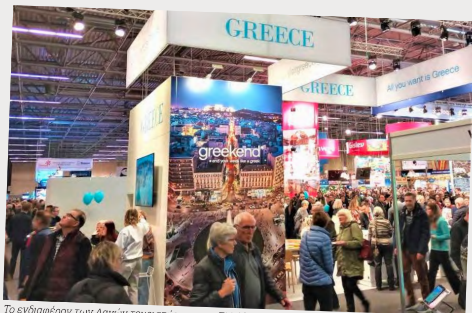
Το ενδιαφέρον των Δανών τουριστών για την Ελλάδα παραμένει ιδιαίτερα αυξημένο και το 2023.

Το περίπτερο του ΕΟΤ επισκέφθηκε, εξάλλου, ο πρέσβης της Ελλάδας στην Δανία, Φραγκίσκος Κωστελλένος, και ο Πρέσβης της Κύπρου, Ιάκωβος Κιρακοσιάν, οι οποίοι συναντήθηκαν με τους συνεκθέτες.