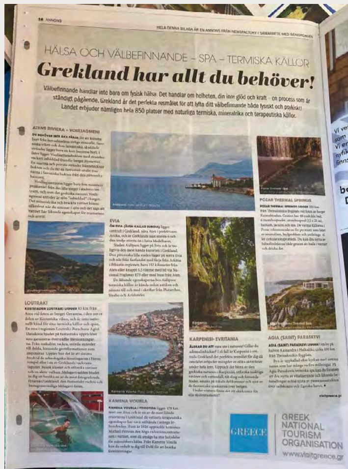
Διαφημιστική καταχώρηση -advertorial στην ειδική εφημερίδα/έκδοση "Det Ljuva Livet" (The Good life), ένθετο στην Dagens Nyheter

Το περίπτερο του Ε.Ο.Τ. επισκέφθηκε ο Πρέσβης της Ελλάδας στη Σουηδία κ. Ανδρέας Φρυγανάς ο οποίος συναντήθηκε και συνομήλησε με τους εκπροσώπους των προορισμών που συμμετείχαν.