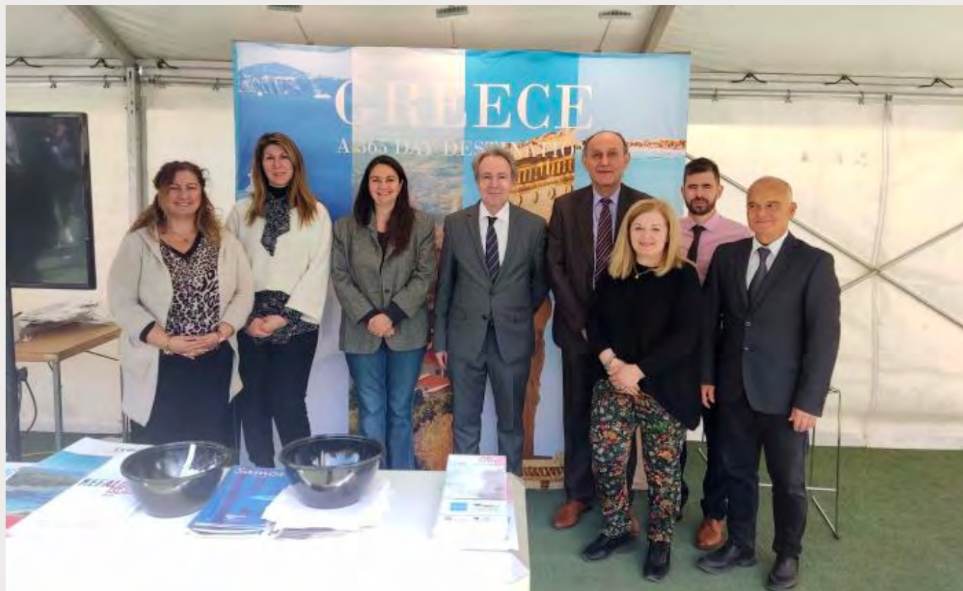
Στιγμιότυπο από την επίσκεψη του Πρέσβη της Ελλάδας στη Σουηδία κ. Ανδρέα Φρυγανά (κέντρο) με τους εκπροσώπους της Περιφέρειας Κεντρικής Μακεδονίας, Τουριστικό Οργανισμό Λουτρακίου και ΕΟΤ.

Σημαντική υπήρξε η ανταπόκριση και το ενδιαφέρον των επισκεπτών, που σύμφωνα με τους διοργανωτές