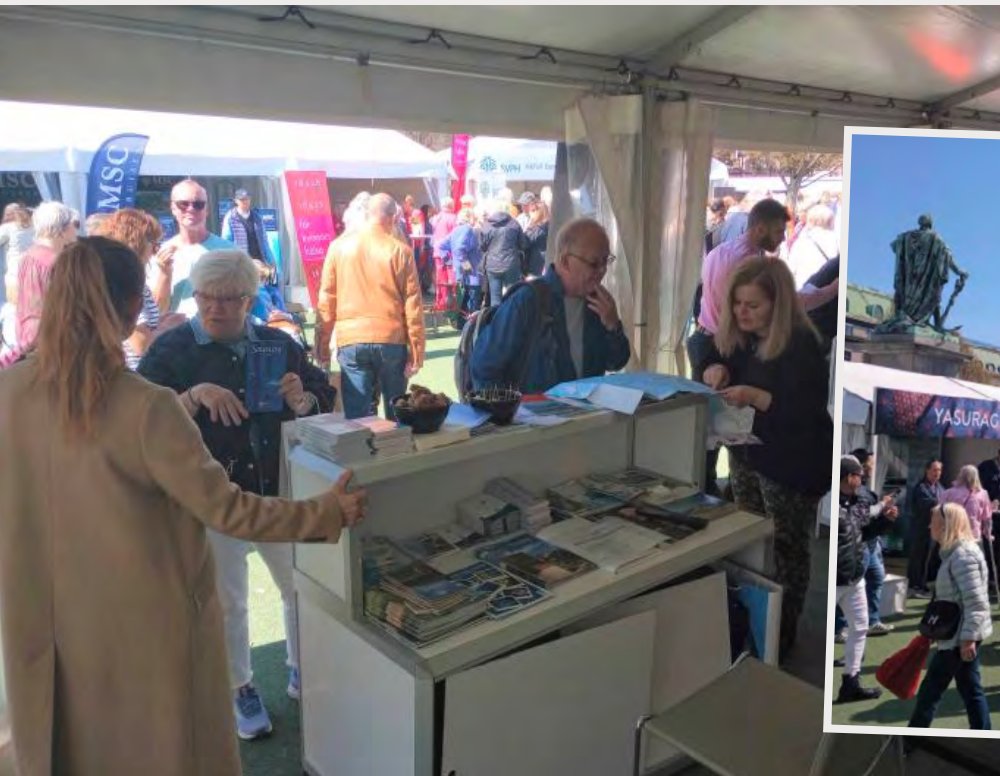
Αποψη περιπτέρου ΕΟΤ