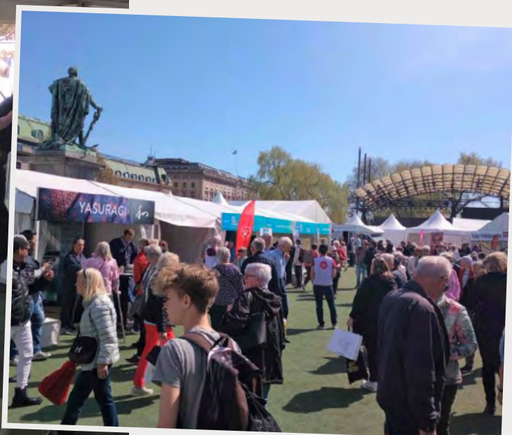
Στιγμιότυπο από την εκδήλωση

Η δράση προβλήθηκε πριν την πραγματοποίηση της εκδήλωσης, στην ειδική έκδοση "Det Ljuva Livet" (The Good life), η οποία κυκλοφόρησε ως «ένθετο» στην ευρείας κυκλοφορίας Εφημερίδα της Σουηδίας Dagens Nyheter (DN) με κυκλοφορία 283.000 φύλλα και κοινό 51% γυναίκες και 49% άνδρες ηλικίας 40-65 ετών.