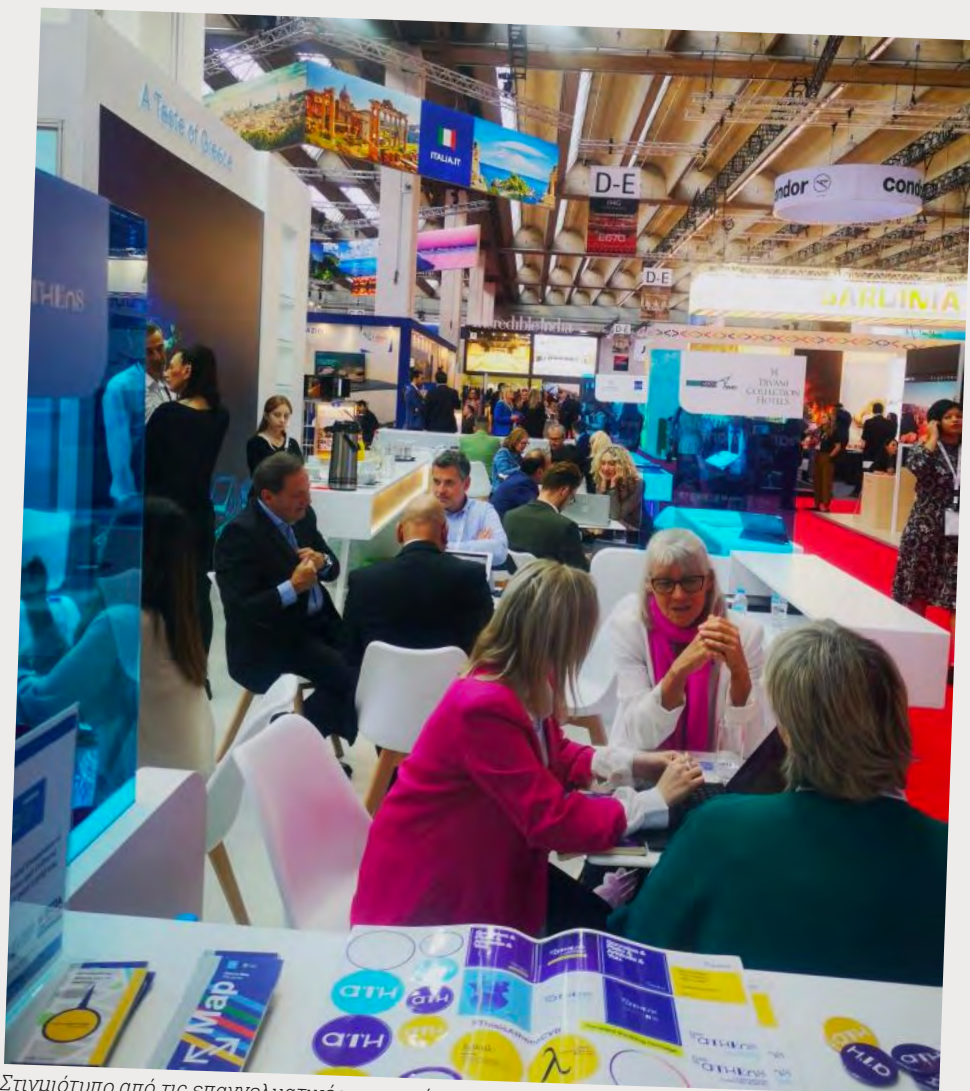
Στιγμιότυπο από τις επαγγελματικές συναντήσεις στο ελληνικό περίπτερο.

Οι προσκεκλημένοι buyers και θεσμικοί εκπρόσωποι της MICE βιομηχανίας είχαν την ευκαιρία να απολαύσουν cocktails με χαρακτηριστικά ελληνικά ποτά όπως μαστίχα και τσίπουρο, καθώς και ελληνικό κρασί.