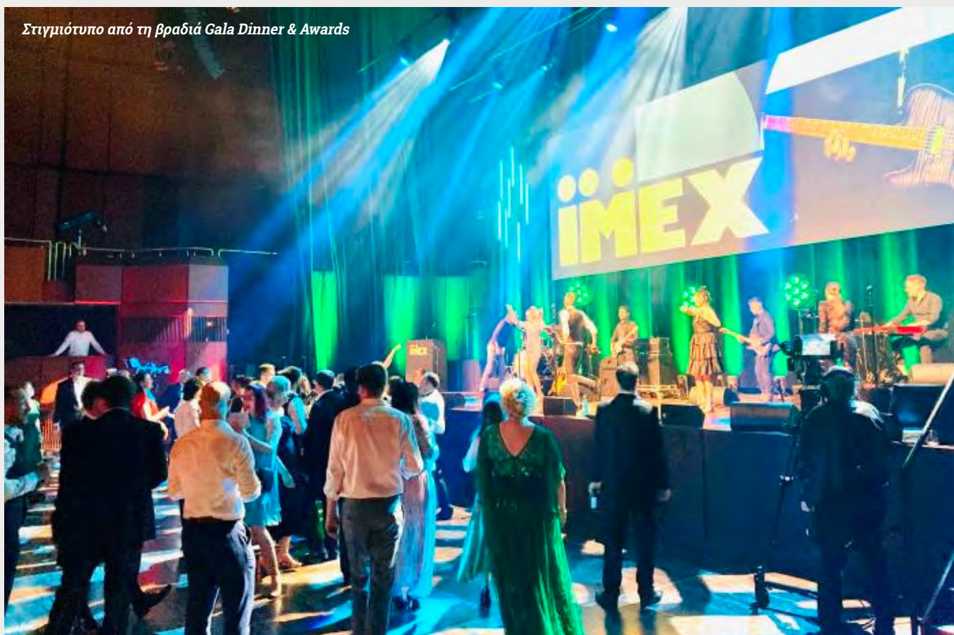
Στιγμιότυπο από τη βραδιά Gala Dinner & Awards

https://www.imexexhibitions.com/media/press/positivity-pride-and-business-growth-sum-up-imex-frankfurt-2023