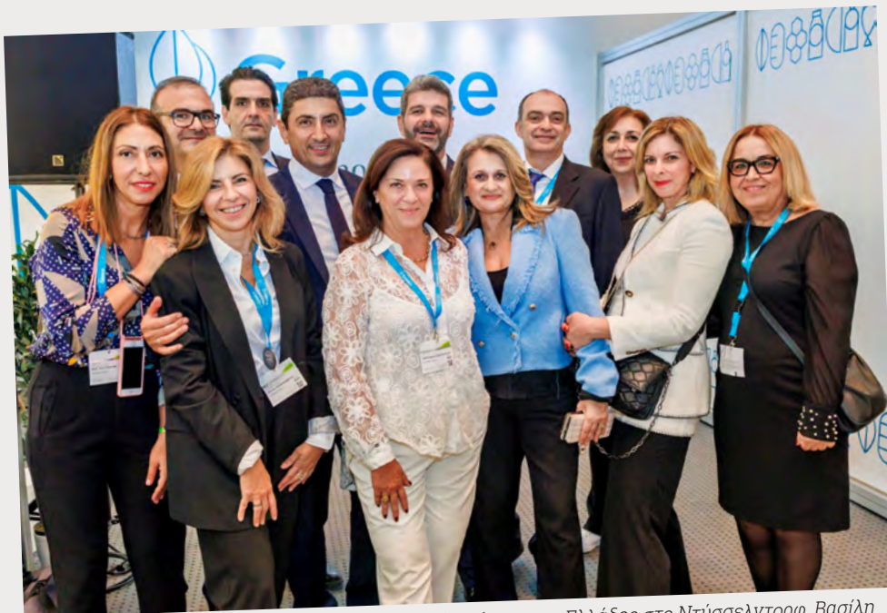
Η αποστολή της Enterprise Greece, με τον Γενικό Πρόξενο της Ελλάδος στο Ντύσσελτορφ, Βασίλη Κοϊνή και τον Υπουργό Αγροτικής Ανάπτυξης και Τροφίμων, Λευτέρη Αυγενάκη.

Με στόχο τη διερεύνηση εμπορικών συνεργασιών, αλλά και πιθανών επενδυτικών συνεργειών, πραγματοποιήθηκε πληθώρα επιχειρηματικών συναντήσεων μεταξύ ελληνικών και αλλοδαπών επιχειρήσεων, τόσο ανεξάρτητα, όσο και μέσω της ειδικά διαμορφωμένης ηλεκτρονικής πλατφόρμας που λειτουργήσε για πρώτη φορά φέτος σε συνεργασία με το Enterprise Europe Network. Συνολικά, πραγματοποιήθηκαν 19.000 επιχειρηματικές συναντήσεις, κυρίως στα booths των συμμετεχουσών εταιρειών, αλλά και σε ειδικά διαμορφωμένο χώρο στο ελληνικό περίπτερο,