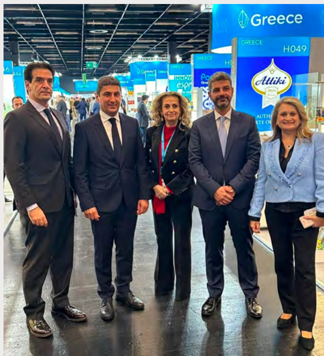
Ο Γενικός Πρόξενος της Ελλάδος στο Ντύσσελντορφ, Βασίλης Κοϊνης, ο Υπουργός Αγροτικής Ανάπτυξης και Τροφίμων, Λευτέρης Αυγενάκης, η Πρόεδρος του ΕΒΕΑ, Σοφία Κουνενάκη Εφραίμογλου, ο Διευθύνων Σύμβουλος της Enterprise Greece, Μαρίνος Παννόπουλος και η Εντεταλμένη Σύμβουλος και Εκτελεστικό μέλος Δ.Σ. της Enterprise Greece, Μπέττυ Αλεξανδροπούλου.

Για την παρουσία της Ελλάδας στην Anuga 2023 και τη συμβολή της Enterprise Greece στην προβολή και προώθηση των ελληνικών προϊόντων στο εξωτερικό, μίλησε ο Διευθύνων Σύμβουλος της εταιρείας, κ. Μαρίνος Παννόπουλος : «Η Enterprise Greece, στηρίζει εμπράκτως και με δυναμικό τρόπο τις ελληνικές επιχειρήσεις να εξάγουν τα προϊόντα τους σε όσο το