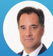
Adonis Georgiadis, Minister of Labour and Social Affairs

Organizer CLEON Conferences Communications