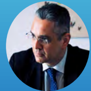
Yannis Mastrogeorgiou, Special Secretary of Foresight, Presidency of the Greek Government