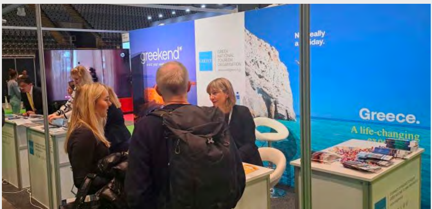
Άποψη του περιπτερού του ΕΟΤ στην Έκθεση Reiselivsmessen/Travelxpο 2024

Συναντήσεις πραγματοποιήθηκαν στο περίπτερο μας με εκπροσώπους μεγάλων Τουριστικών Περιοδικών της Νορβηγίας όπως το REIS και Pensjonisten, καθώς και με εκπρόσωπο της ANTOR Norway.