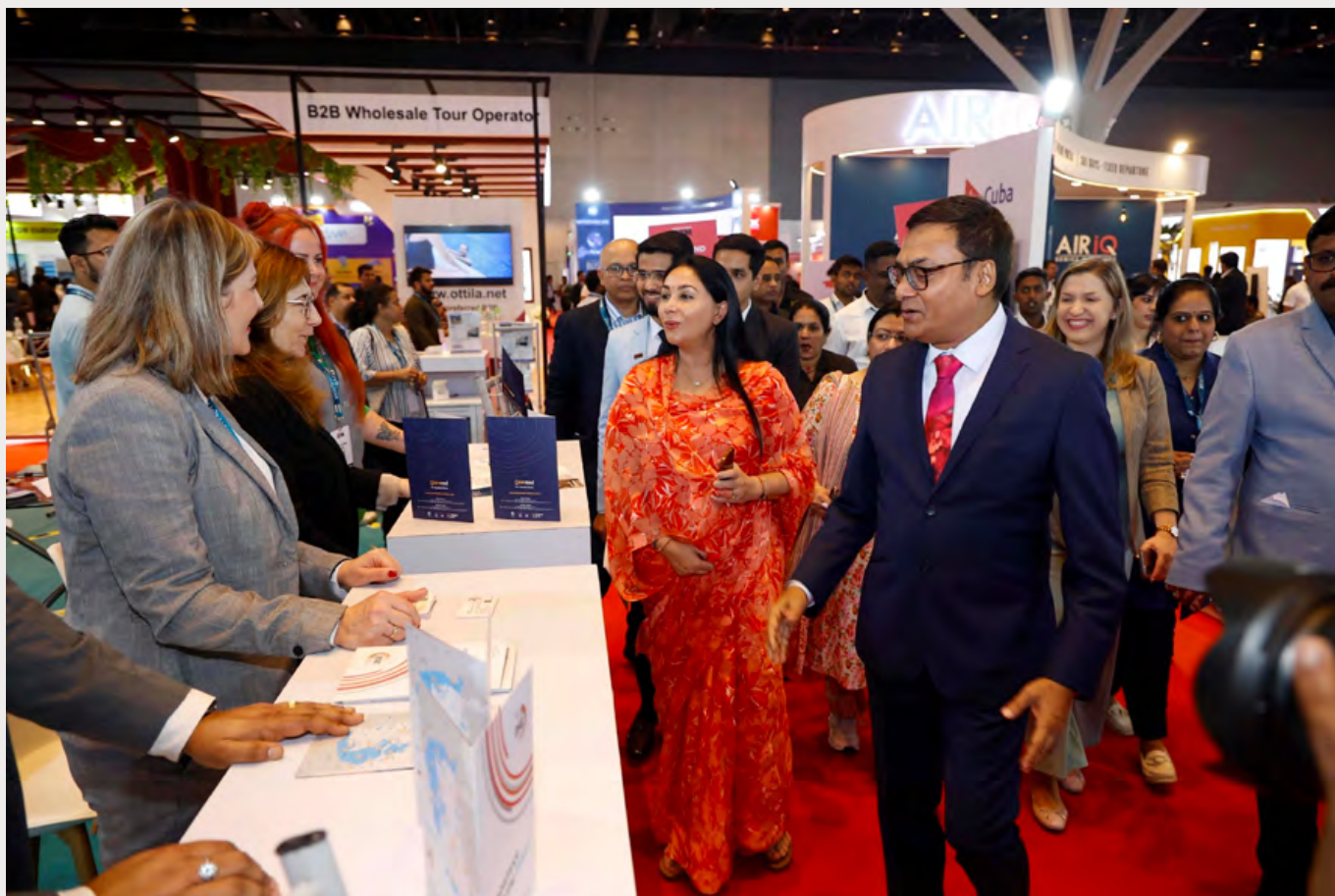
Η αναπληρώτρια Πρωθυπουργός και Υπουργός Τουρισμού της Πολιτείας του Rajasthan Diya Kumari επισκέφτηκε το περίπτερο συνοδευόμενη από τον Sanjeev Agarwal, Ιδρυτή, Διευθύνοντα Συμβούλου της Fairfest Media, διοργανώτριας εταιρείας της OTM.

του από το Athens Convention Bureau- This is Athens, την Hellenic Memories Travel Services, την Mazi Travel- Travel & Events και την Travel Factory καθώς και τις εταιρείες ASIT- Anatolia Travel (Anatolia Hospitality group) Greece, την TourGreece, και την Sanmed Travel Hub.