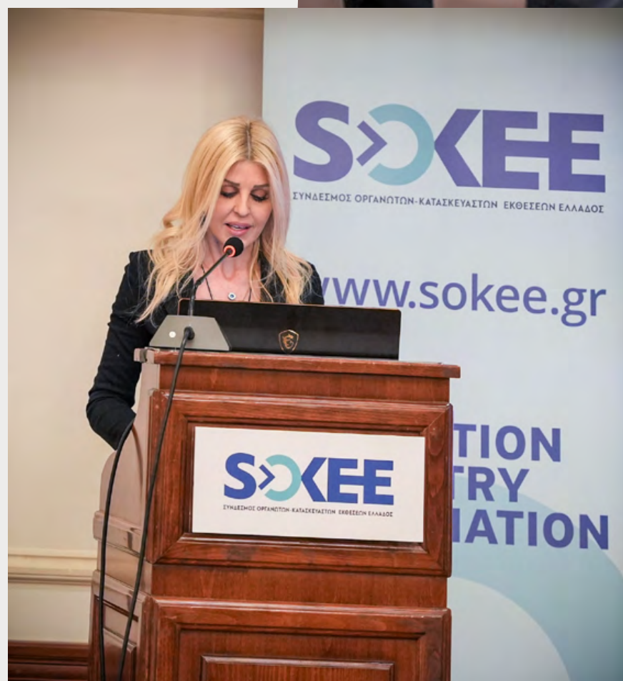
Έλενα Ράπτη, Υφυπουργός Τουρισμού

προχωρήσει ακόμη πιο μπροστά. Η χώρα μας βρίσκεται στο επίκεντρο μιας ακτίνας αγορών που ξεπερνάνε τα 150 εκατ. κατοίκους και μπορεί να αποτελέσει το εμπορικό επίπλευρο των επιχειρήσεων απ' όλον τον κόσμο που αναζητούν διαύλους επικοινωνίας με αυτές τις αγορές.