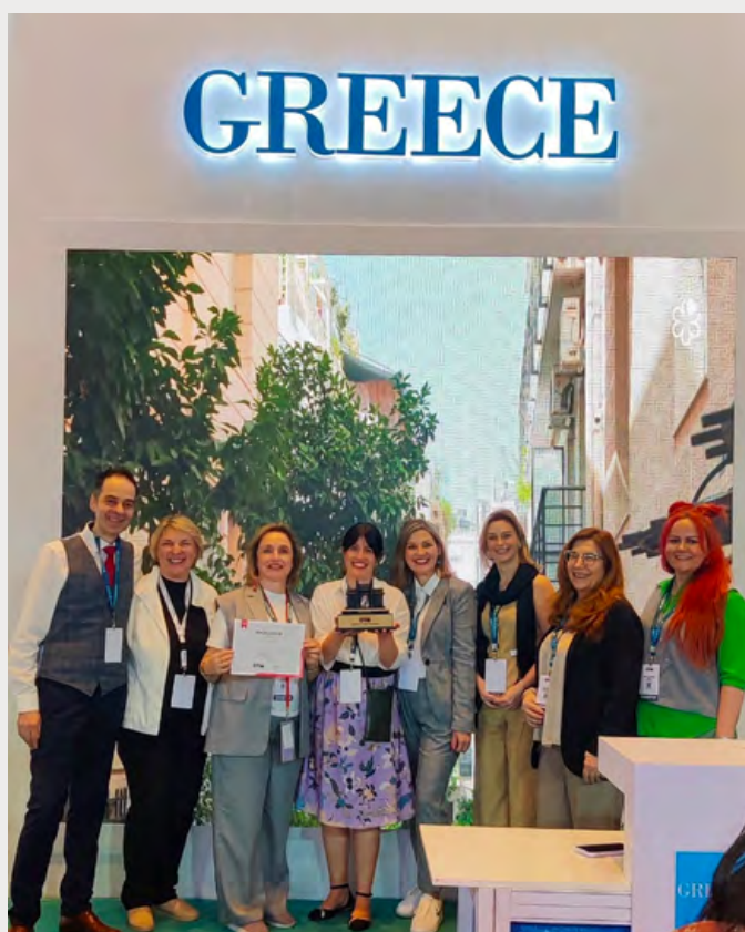
Στελέχη και συνεκθέτες του ΕΟΤ από το Athens Convention Bureau, τις εταιρείες HELLENIC MEMORIES TRAVEL SERVICES, τη Sanmed Travel Hub, Mazi Travel- Travel & Events και ASIT Anatolia Travel

Η διευρυμένη παρουσία του ο ΕΟΤ στην OTB 2024 περιλάμβανε συνεκθέτες από την Ελλάδα, όπως του Hatta (Σύνδεσμος των εν Ελλάδι Τουριστικών & Ταξιδιωτικών Γραφείων) και την παρουσία εκπροσώπων