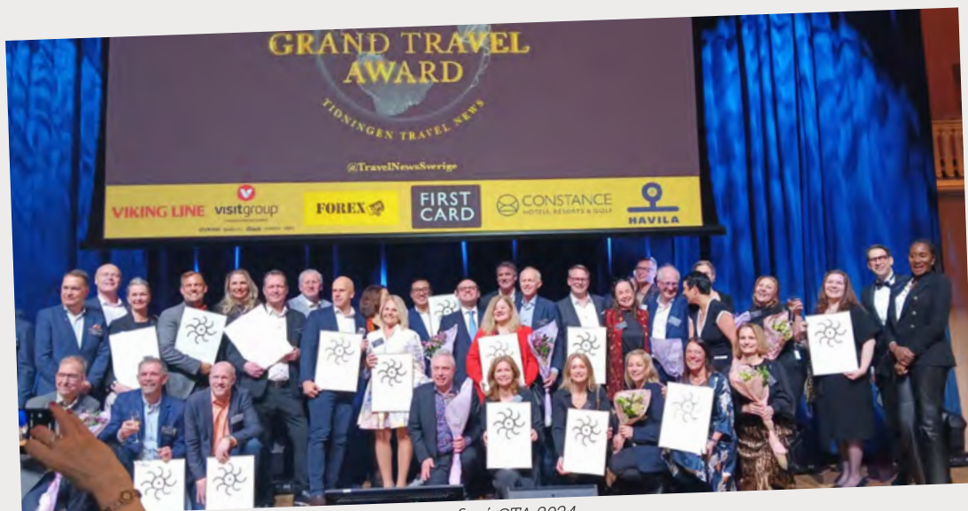
Στιγμιότυπο με όλους τους βραβευθέντες στα σουηδικά GTA 2024.

Σύμφωνα με τα τελευταία στοιχεία αφίξεων στα ελληνικά αεροδρόμια, κατά το 2023 επισκέφθηκαν την Ελλάδα 544.097 Σουηδοί, με κύριους παράγοντες ικανοποίησής τους την ελληνική κουζίνα και το αίσθημα ασφάλειας που απολαμβάνουν στη χώρα μας.