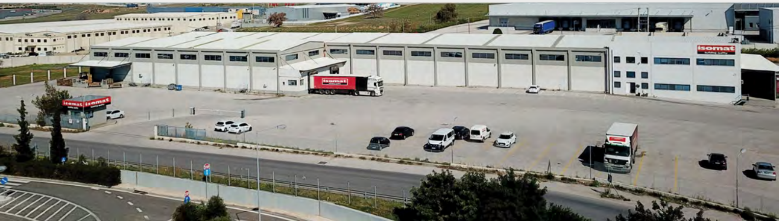
Εγκαταστάσεις ISOMAT, Ασπρόπυργος

συστημάτων που ανταποκρίνονται στις σύγχρονες απαιτήσεις του κατασκευαστικού κλάδου διεθνώς. Παράλληλα, η εξωστρέφεια αποτελεί κομμάτι ζωτικής σημασίας για τη στρατηγική μας, με όραμα να συμμετέχουμε σε ολοένα και περισσότερα διεθνή projects και να βάζουμε τη δική μας πινελιά σε καινοτόμες κατασκευές-ορόσημα. Η προσπάθεια ενδυναμώνεται, μεταξύ άλλων, με το πλάνο συμμετοχής μας σε κορυφαίες εκθέσεις του κλάδου σε όλο τον κόσμο, ενώ η χρονιά έχει ήδη ξεκινήσει με τη δυναμική μας συμμετοχή στις εκθέσεις World of Concrete στο Las Vegas, BUDMA στην Πολωνία και WORLDBEX στις Φιλιππίνες και συνεχίζεται προσεχώς με την CONSTRUCTUMAT στη Βαρκελώνη, την MARE SUMMIT στη Μάλτα, την THE BIG 5 CONSTRUCT στη Νότια Αφρική, την BATIMAT στη Γαλλία, το P&D SHOW στο Ηνωμένο Βασίλειο και την BIG 5 στο Ντουμπάι, μεταξύ άλλων.