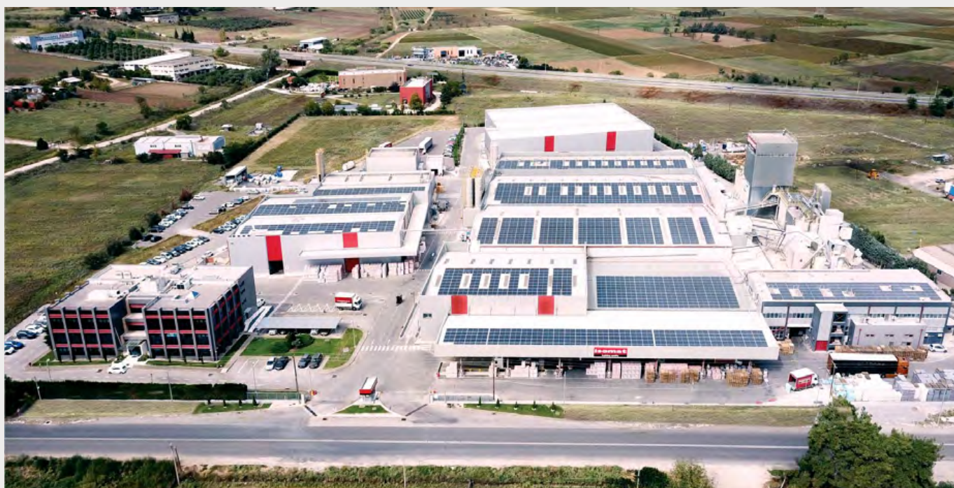
Εγκαταστάσεις ISOMAT, Άγιος Αθανάσιος