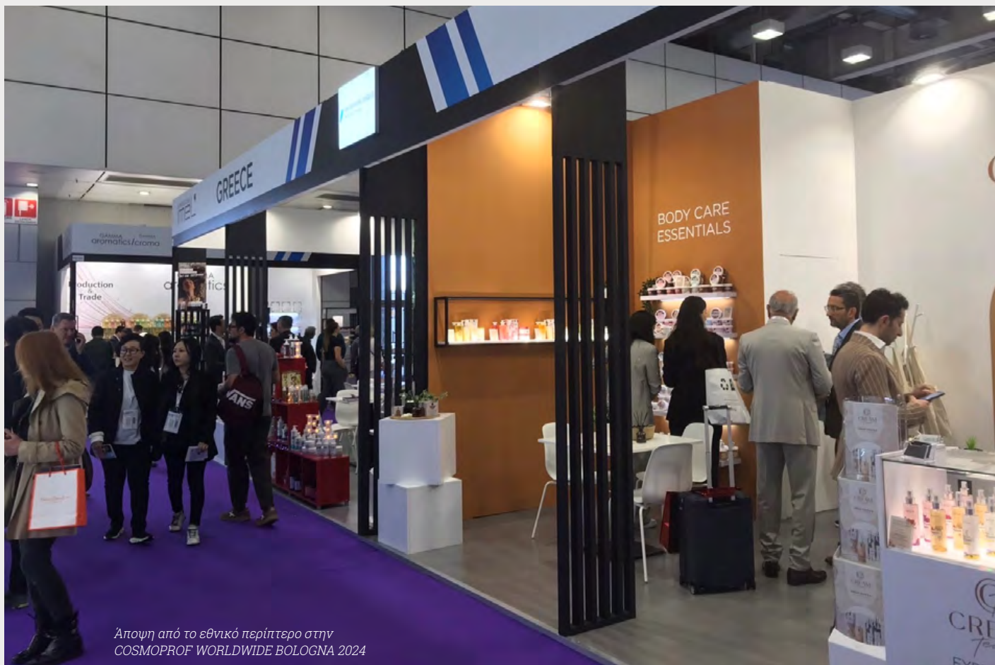
Άποψη από το εθνικό περίπτερο στην COSMOPROF WORLDWIDE BOLOGNA 2024

Η παρουσία των ελληνικών επιχειρήσεων στη Διεθνή Έκθεση Cosmoprof Worldwide Bologna συνδυάστηκε και τη φετινή χρονιά με την καινοτομία και την ποιότητα των προϊόντων, στοιχεία που συμβάλλουν στη αναγνώριση των ελληνικών καλλυντικών στις διεθνείς αγορές και τα καθιστούν εξαιρετικά ανταγωνιστικά στην παγκόσμια αγορά.