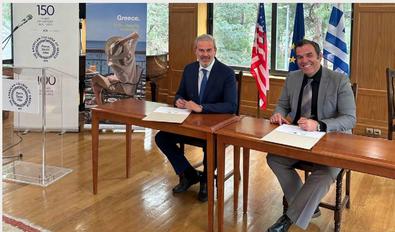
Ο Γενικός Γραμματέας του ΕΟΤ, κ. Δημήτρης Φραγκάκης, και ο Αντιπρόεδρος Ακαδημαϊκών Υποθέσεων του Κολλεγίου, Καθηγητής Πάνος Βλαχόπουλος