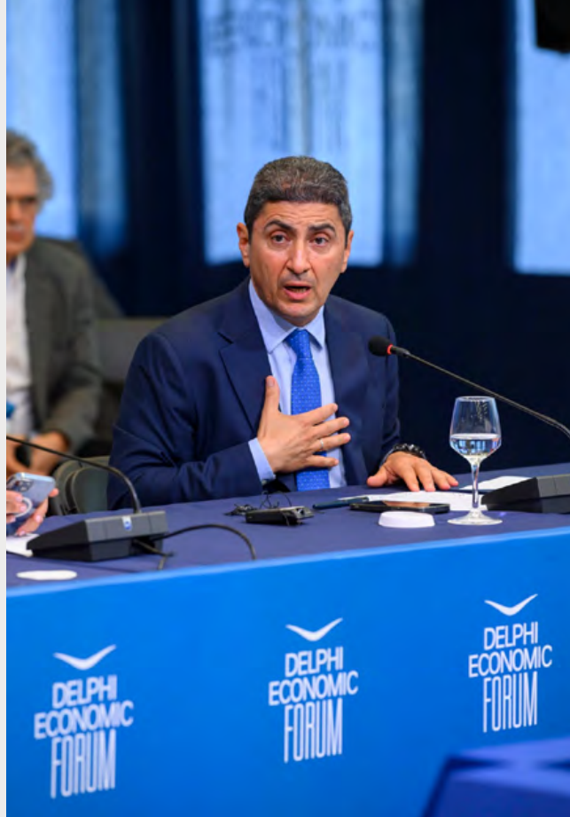
Λευτέρης Αυγενάκης, Υπουργός Αγροτικής Ανάπτυξης και Τροφίμων

Τόνισε, δε, ότι για πρώτη φορά ύστερα από πολλά χρόνια και πιο συγκεκριμένα από τη δεκαετία του 1930, το ελληνικό κράτος παίρνει μέτρα λαμβάνοντας υπόψη την ύδρευση, η οποία απασχολεί το 83% του κόσμου. Επιπλέον είναι η πρώτη φορά που τρία υπουργεία (Αγροτικής Ανάπτυξης, Περιβάλλοντος- Ενέργειας,