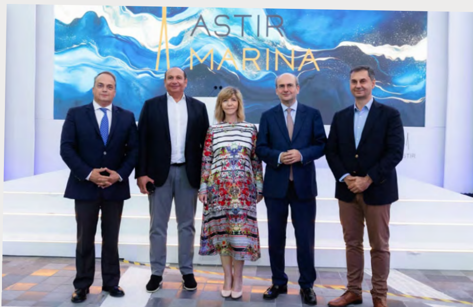
Από τα αριστερά: Δήμαρχος Βάρης -Βούλας -Βουλιαγμένης, κ. Γρηγόρης Κωνσταντέλος, Co – CEO της AGC Equity Partners, κ. Walid Abu Suud, CEO Astir Palace Vouliagmenis και Πέννυ Ζαγλαρίδου, Υπουργός Εθνικής Οικονομίας και Οικονομικών, κ. Κωστής Χατζηδάκης, Υφυπουργός Οικονομικών Χάρης Θεοχάρης, στην εκδήλωση εγκαινίων της Astir Marina.

Σχεδιάστηκε σύμφωνα με τους πιο σύγχρονους περιβαλλοντικούς όρους και τα αυστηρότερα κριτήρια διεθνώς αναγνωρισμένων προτύπων, ως προς το σύνολο της κατασκευής και των λειτουργιών της. Σήμερα, προσφέρει