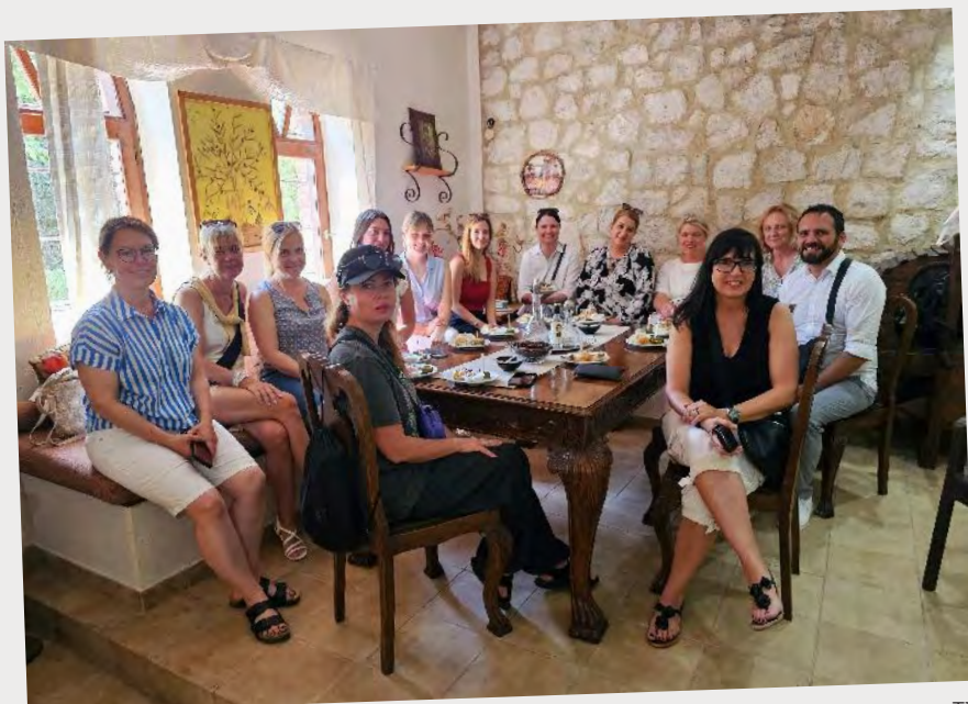
Ομαδικό στιγμιότυπο από την επίσκεψη σε βιολογικό αμπελώνα

αποτελούν σημαντικό παράγοντα για την επιτυχημένη ένταξη της Θεσσαλονίκης και της Χαλκιδικής σε τουριστικά πακέτα.