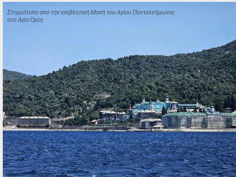
Στιγμιότυπο από την επιβλητική Μονή του Αγίου Παντελεήμωνος στο Άγιο Όρος