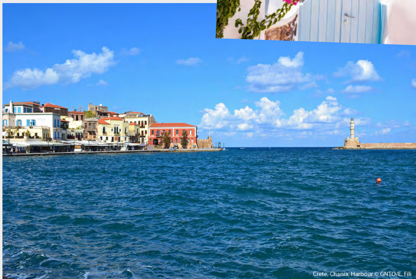
Crete, Chania, Harbour