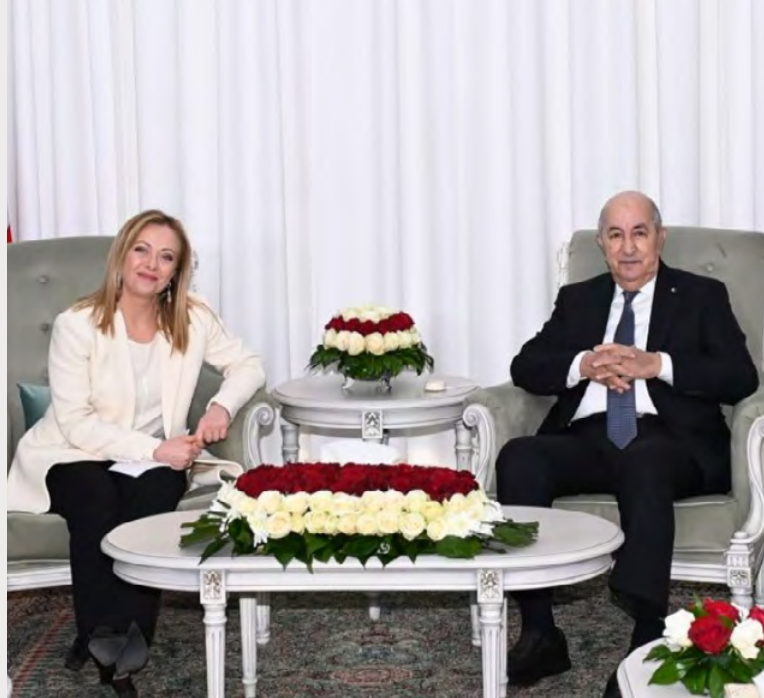
Από τις συζητήσεις μεταξύ Ρώμης και Αλγερίας το 2022

Εκείνη την εποχή, το αλγερινό Υπουργείο Ενέργειας σημείωσε ότι η Sonatrach είχε συζητήσει με το ιταλικό Υπουργείο Ενέργειας Transition τις δυνατότητες δρομο-