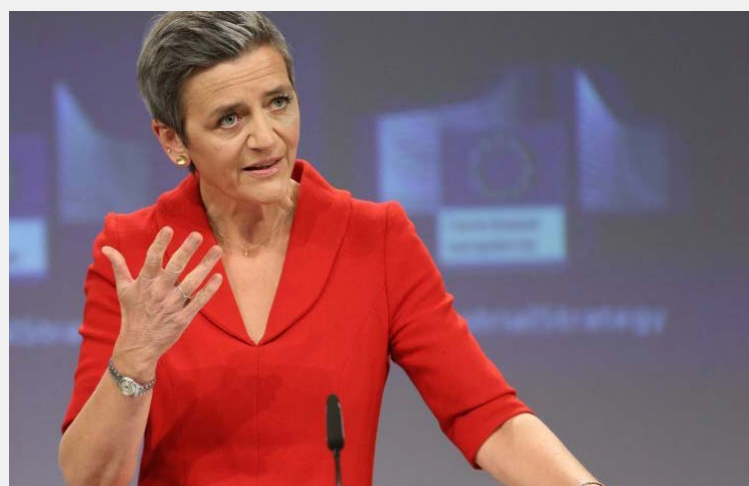
Η Μαργκρέτε Βέστεϊγιερ, Εκτελεστική Αντιπρόεδρος για μια Ευρώπη Έτοιμη για την Ψηφιακή Εποχή

Το πρόγραμμα επενδύει επίσης στη διασφάλιση της απόκτησης των κατάλληλων δεξιοτήτων από τους Ευρωπαίους ώστε να συμμετέχουν ενεργά στην αγορά εργασίας. Ο σκοπός είναι να έχουν όλοι στην Ευρώπη — πολίτες, επιχειρήσεις και διοικητικές αρχές — τη δυνατότητα να επωφεληθούν από τεχνολογικές λύσεις που είναι έτοιμες για την αγορά» δήλωσε χαρακτηριστικά η Μαργκρέτε Βέστεϊγιερ, Εκτελεστική Αντιπρόεδρος για μια Ευρώπη Έτοιμη για την Ψηφιακή Εποχή.