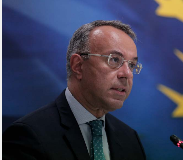
Ο υπουργός Οικονομικών Χρήστος Σταϊκούρας

Ερωτηθείς εάν θα υπάρξει μέρισμα στους αδύναμους πολίτες από τον υψηλότερο ρυθμό ανάπτυξης, ο υπουργός- αφού απαρίθμησε τις θετικές εξελίξεις στην οικονομία (αύξηση διαθέσιμου εισοδήματος νοικοκυριών, σημαντική συρρίκνωση της φτώχειας, αύξηση καταθέσεων, μείωση ανεργίας κ.ά.) και τις μειώσεις των φόρων και τα μέτρα στήριξης- απάντησε πως «αυτή τη στιγμή δεν μπορώ να καλλιεργήσω κάποια πρόσθετη προσδοκία, διότι δεν γνωρίζουμε την ένταση της υγειονομικής και ενεργειακής κρίσης». Είπε ότι αυτές μειώνουν τις δημοσιονομικές δυνατότητες για πρόσθετες παροχές πέραν αυτών που εξαγγέλθηκαν στη ΔΕΘ και θα υλοποιηθούν.