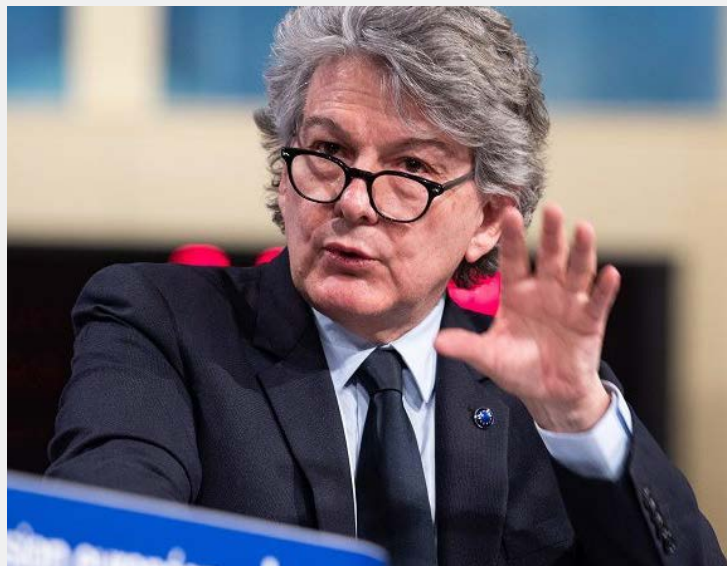
Ο Τιερί Μπρετόν, Επίτροπος Εσωτερικής Αγοράς

Στο πρόγραμμα εργασίας για την κυβερνοασφάλεια προβλέπονται επενδύσεις στην ανάπτυξη προηγμένου εξοπλισμού, εργαλείων και υποδομών δεδομένων για την κυβερνοασφάλεια. Θα χρηματοδοτηθεί η ανάπτυξη και η βέλτιστη χρήση των γνώσεων και δεξιοτήτων που σχετίζονται με την κυβερνοασφάλεια, θα προωθηθεί η ανταλλαγή βέλτιστων πρακτικών και θα διασφαλιστεί η ευρεία διάδοση λύσεων αιχμής στον τομέα της κυβερνοασφάλειας σε ολόκληρη την ευρωπαϊκή οικονομία.